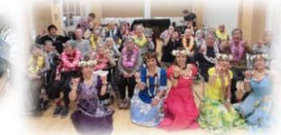
ボランティアさんフラダンス披露