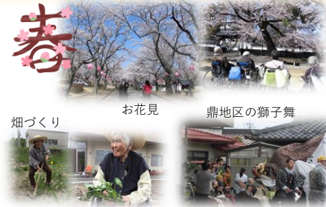
畑づくり お花見 鼎地区の獅子舞