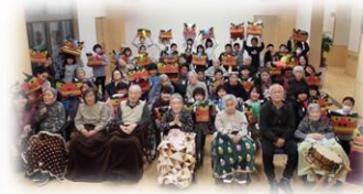
近隣小学生との交流