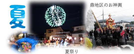
夏祭り 鼎地区のお神輿