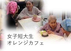
女子短大生 オレンジカフェ