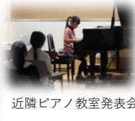
近隣ピアノ教室発表会